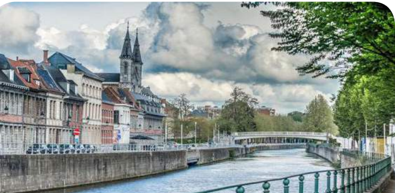
L'Escaut à Tournai

Au-delà des leviers d'actions, les démarches seront mises à l'épreuve. C'est par cet angle que Lille Métropole envisage les bienfaits du design et gagne le statut de Capitale Mondiale du Design pour 2020, raisonnant non pas en terme d'objet fini mais de «processus intellectuel créatif, pluridisciplinaire et humaniste, dans le but de traiter et d'apporter des solutions aux problématiques de tous les jours, petites et grandes, liées aux enjeux économiques, sociaux et environnementaux.»